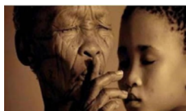
ESCUCHA TU VOZ