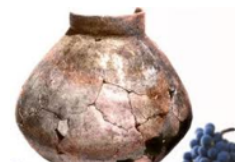
INICIATIVAS PARA ORAR